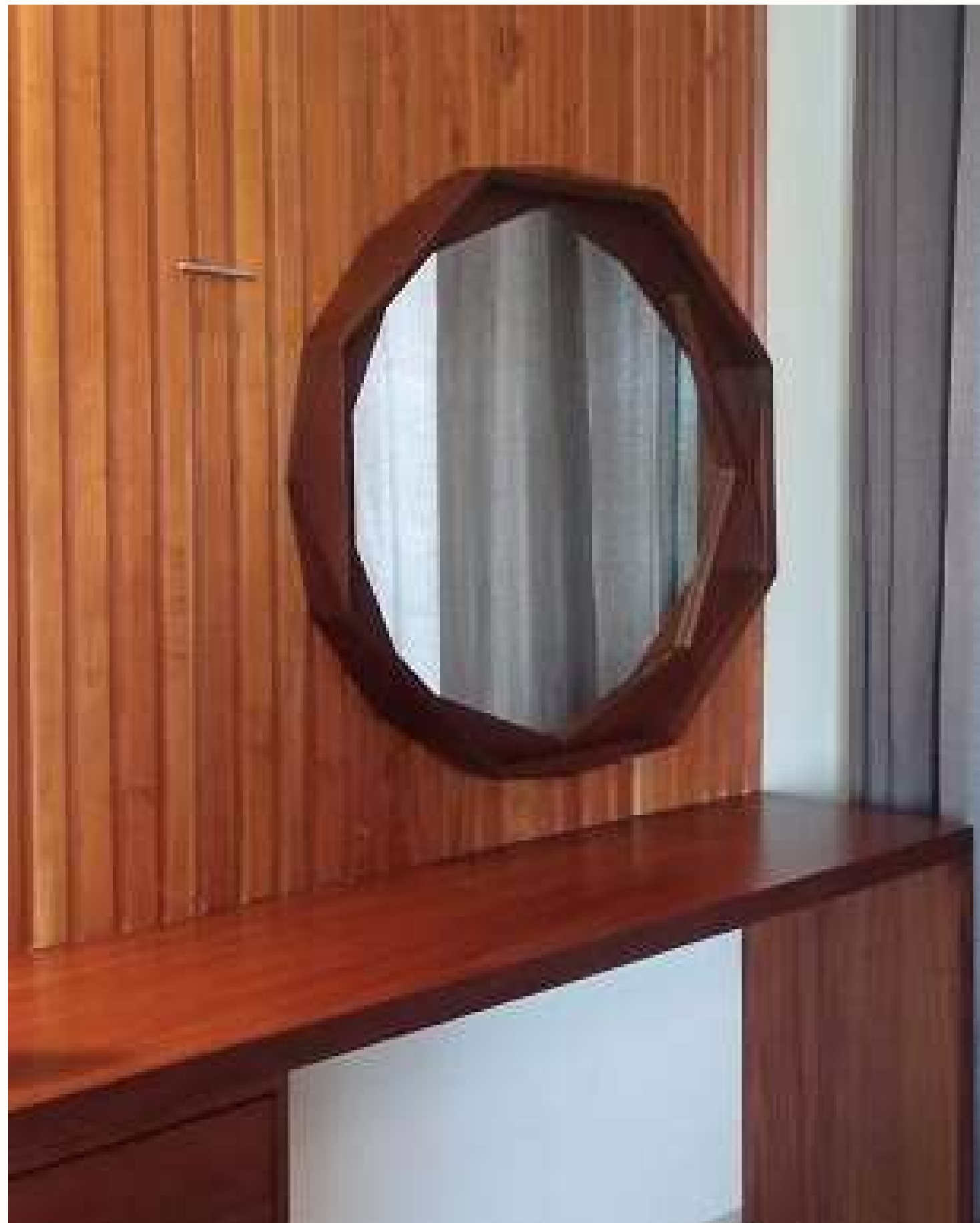
Mobiliario residencial premium en Mérida, Yucatán